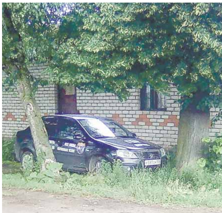
ЧОО «Байкал» в деревне Иваново.