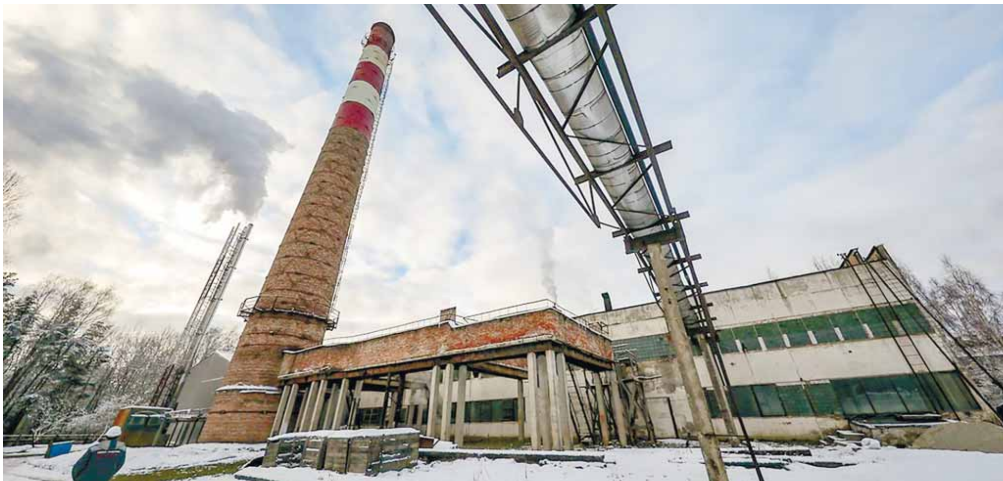
Котельная в Пушкинских Горах.