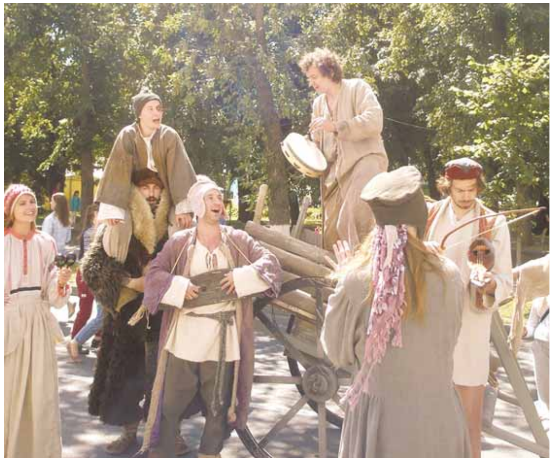
Артисты Псковского академического театра драмы им. А. С. Пушкина на Октябрьском проспекте во время Ганзейских дней.

Проблемы у ганзейцев начались ещё в начале 1494 года. По велению Москвы « ганзейцы лишались права колупать (пробовать) приобретаемый воск и требовать наддачу к мехам, которые они покупали у новгородцев. » Ганза отправила в Москву двух ливонских послов –