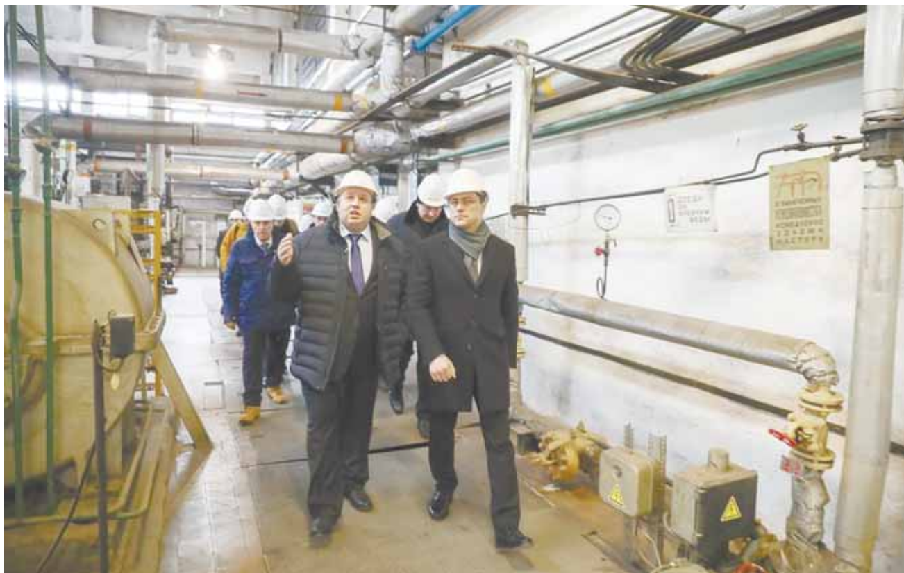
Глава Пушкиногорского района Александр Баранов и губернатор Псковской области Михаил Ведерников.