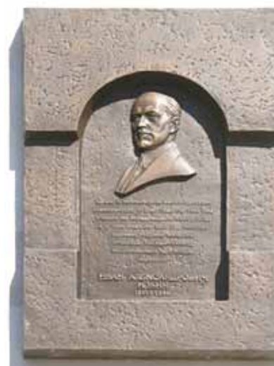
Мемориальная доска в память о философе Иване Ильине. Здание МГУ на Моховой.

Думаю, что здесь всё понятно. Ильин почувствовал родственную связь. Духоподъёмность фашизма