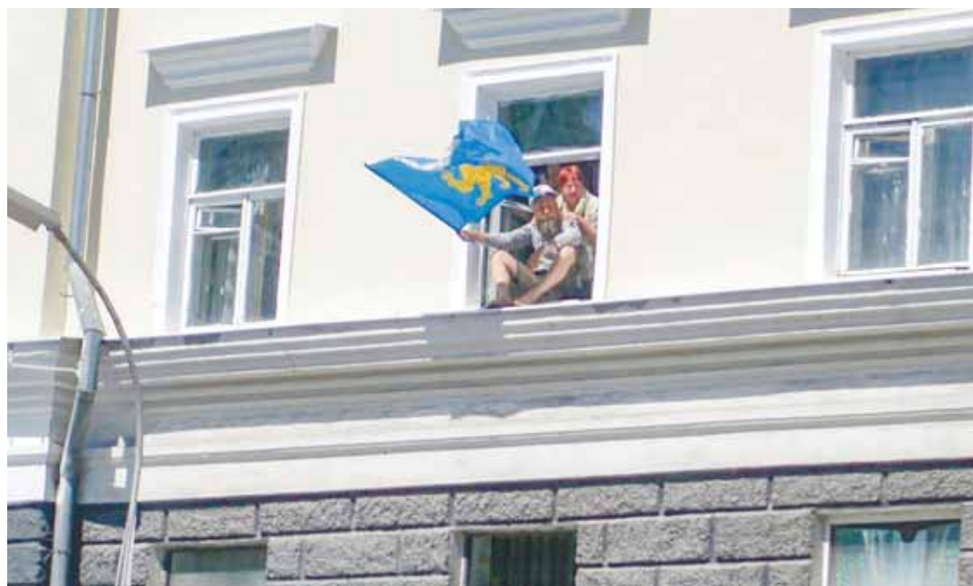
Приветствие участников парада.

Неподалёку от слияния Псковы и Великой стояла реплика девятиметрового викинга конца эпохи викингов. Новая Ганза – это тоже отчасти реплика прежней средневековой Ганзы. Но если в Средневековье иностранные суда ходили в наши края через Балтику, озёра и реки, то сегодня это, скорее, туристический аттракцион (недоброжелатели сказали бы «имитация»). Народ фотографируется на фоне реконструкторов в доспехах, воображая