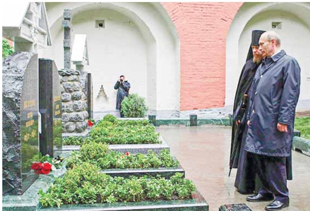
Памятник Ивану Ильину на территории Уральского института бизнеса. Владимир Путин и Тихон Шевкунов на Донском кладбище в Москве.

Вряд ли у Ильина были какие-то личные симпатии к Гитлеру. Но его привлекал «новый дух», который фюрер вселял в германскую нацию. Ильин писал: «Новый дух» национал-социализма имеет, конечно, и положительные определения: патриотизм, вера в самобытность германского народа и силу германского гения, чувство чести, готовность к жертвенному служению (фашистское sacrificio ), дисциплина, социаль-