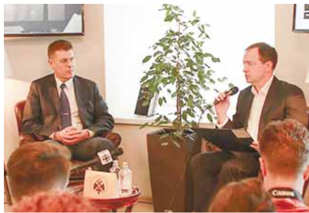
Министр культуры РФ Владимир Мединский на презентации книги «Иван Ильин. Новая национальная Россия». 27 мая 2019 года. Российская государственная библиотека.

В 1928 году в журнале «Русский колокол» Иван Ильин (он же издатель и редактор этого журнала) опубликовал свою статью «О русском фашизме» (И. А. Ильин. О русском фашизме // Русский колокол, № 3, 1928, стр. 54–64). В ней он постоянно называет белогвардейцев «рыцарственным движением», от которого, по его мнению, до русского фашизма совсем недалеко. Похоже, он считал, что русский фашизм лежит в основе всего фашистского движения. Ильин почему-то фактически ставит знак равенства между русским фашизмом и белым движением, зародившимся в 1917 году. И только потом фашисты появились в других европейских странах. Он пишет: «Вслед затем оно (фашистское движение – Авт.) зародилось в Германии, в Венгрии и в 1919 году – в Италии; здесь оно после трёхлетней организационной подготовки и нескольких героических столкновений овладело государственным аппаратом и создало так называемый «фашистский» режим. Этот политический успех заставил наших современников говорить и думать о фашистском «методе»