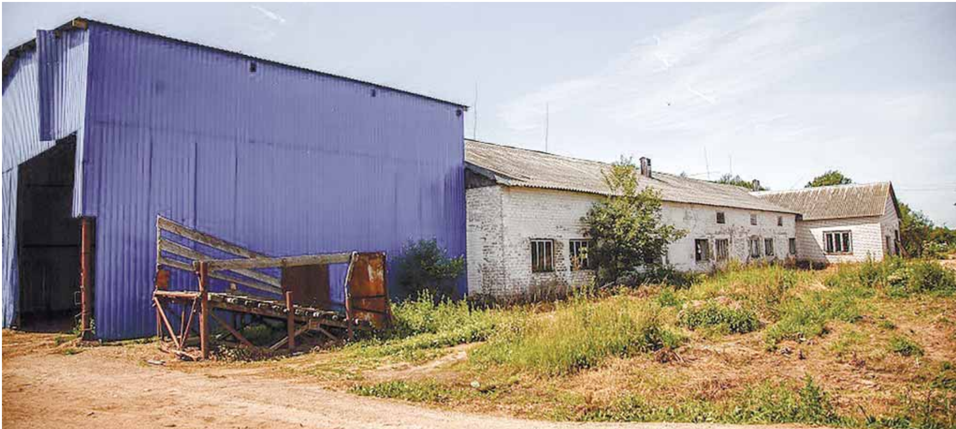
Имущественный комплекс племзавода «Удрайское».