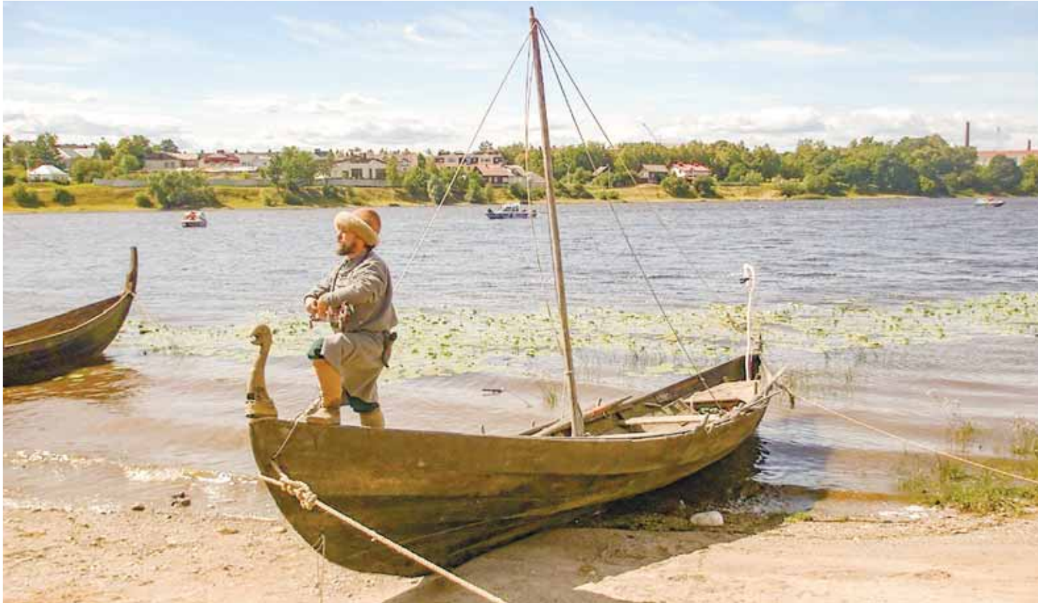
Реплика девятиметрового виккота конца эпохи викингов.

себя причастными то ли к сериалу «Игра престолов», то ли к фильмам «Викинг» или «Александр Невский».